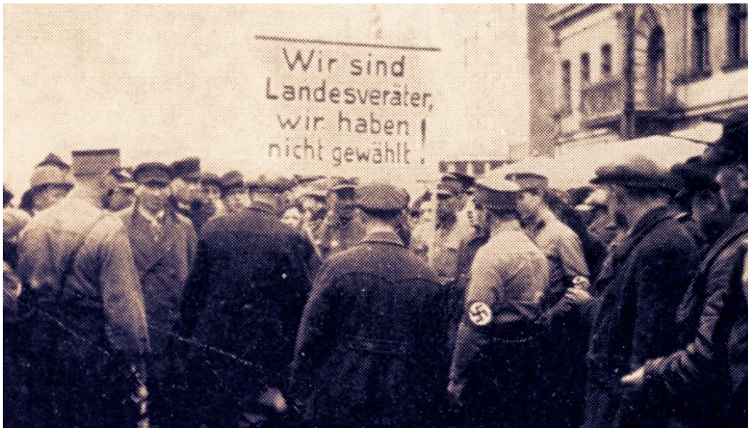
Dat Jehovah's Getuigen niet stemden, werd door de nazi's gezien als landverraad.

Dus vrijwel meteen toen Hitler in Duitsland aan de macht kwam, werden Jehovah's Getuigen daar verboden en actief vervolgd. Ze werden zelfs al in de jaren '30 naar concentratiekampen gestuurd. Tot het uitbreken van de oorlog was hun aandeel in het totale aantal concentratiekampgevangenen doorgaans tussen de vijf en tien procent. In de kampen Moringen en Lichtenburg waren ze bij tijden zelfs de grootste groep gevangenen. 1