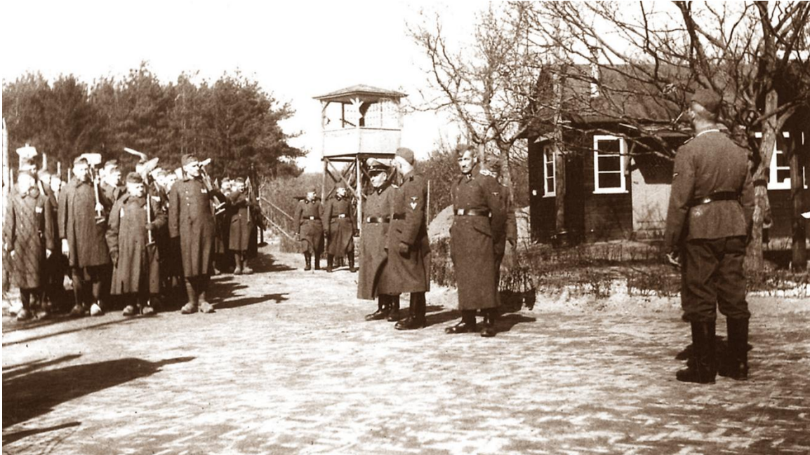
Kamp Amersfoort.

Aart had gelukkig wel zijn mede-Getuigen in het kamp. Een aantal van hen kende hij persoonlijk, zoals de mannen van wie hij de namen tijdens het verhoor door Engelsmann had 'verraden'. Zoals hij het net vertelde, hebben ze er met elkaar nog om moeten lachen ook. Zien dat anderen standvastig bleven en soms zelfs de nazi's te slim af waren, zal ze daar wat extra moed hebben gegeven. Wat extra veerkracht .