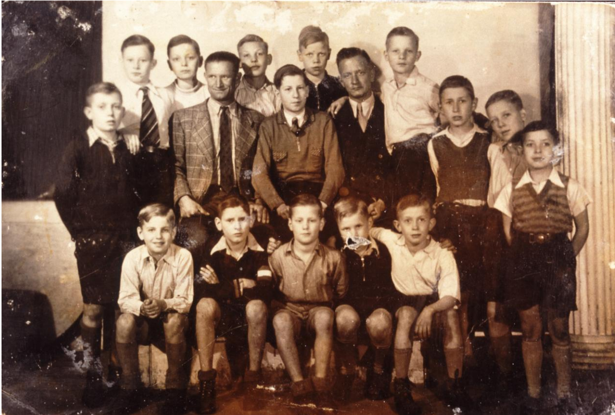
Een deel van de ongeveer 25 kinderen die door de vier Nederlandse Jehovah's Getuigen zijn verzorgd en naar Nederland zijn gebracht. Aart staat niet op deze foto.