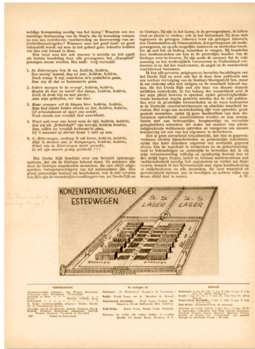
Het tijdschrift Vertroosting van mei 1938 bevatte het artikel 'Ervaringen in het Concentratiekamp Esterwegen', inclusief tekening van dit kamp in Duitsland.