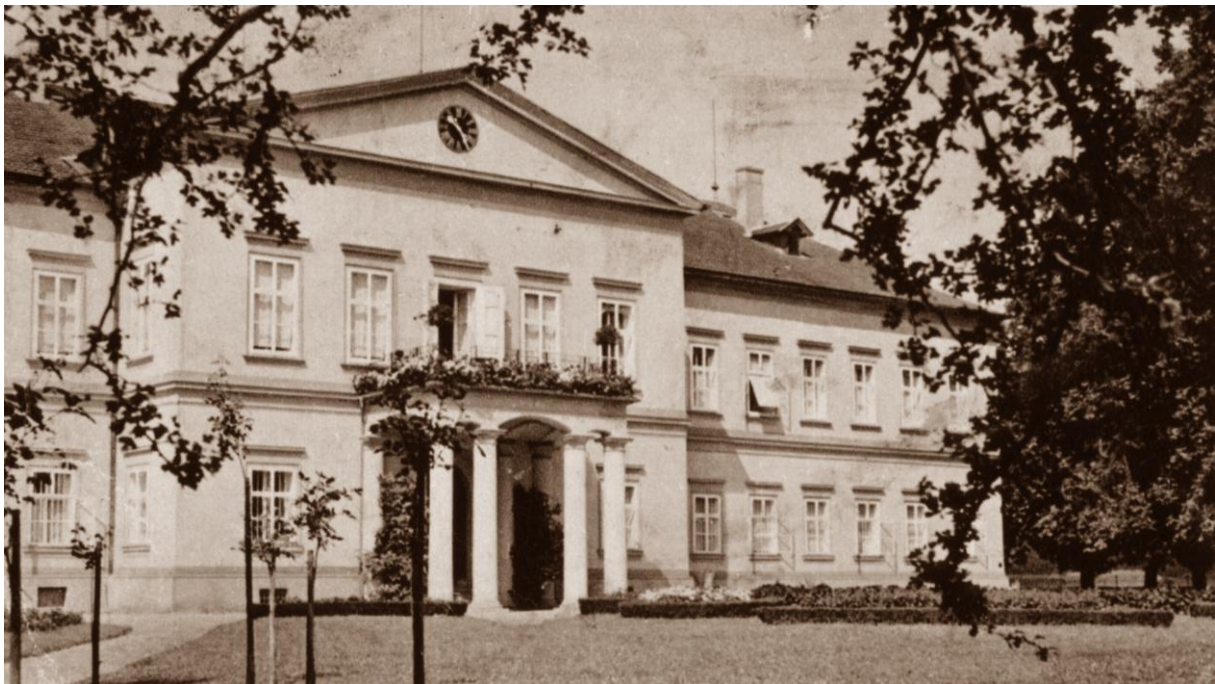
Het landhuis van Heydrich in Panenské Břežany.